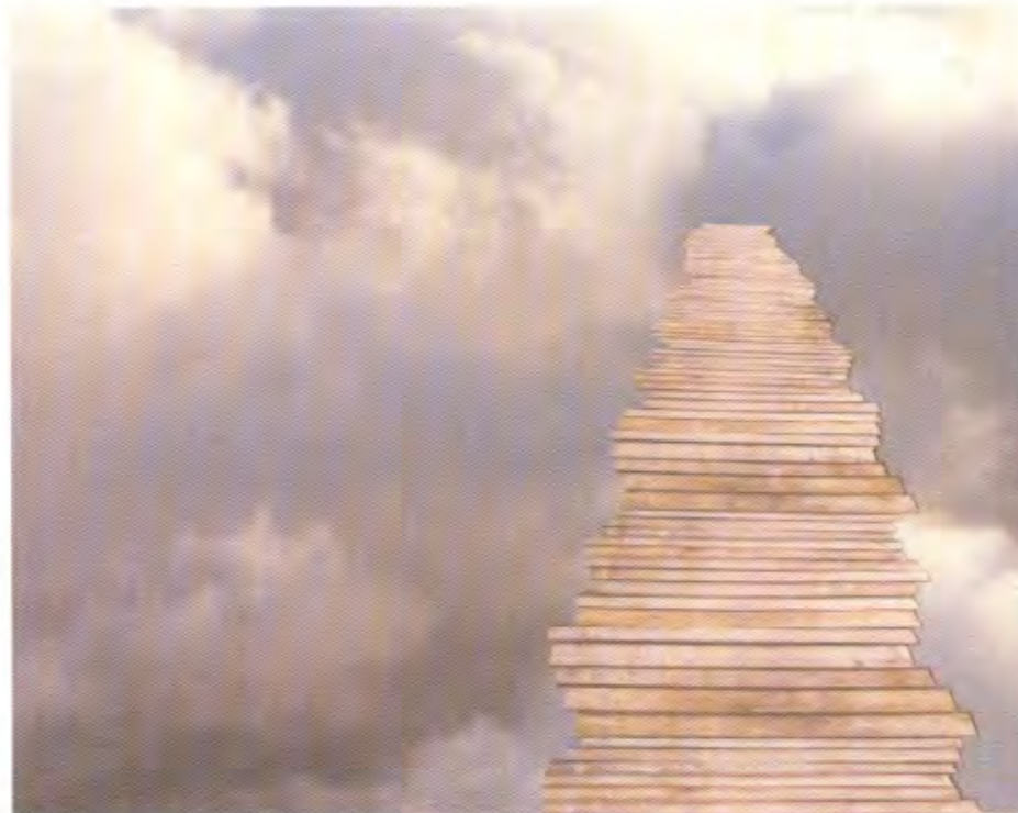
PONTON SUR CIEL. PROJET POUR LA MEZZANINE DE L'ISELP : PHOTO DE CIEL IMPRIMÉ SUR BÂCHE AU SOL ET PONTON EN BOIS. LES VISITEURS SERONT INVITÉS À EMPRUNTER LE PONTON MAIS AUSSI À MARCHER SUR LES NUAGES